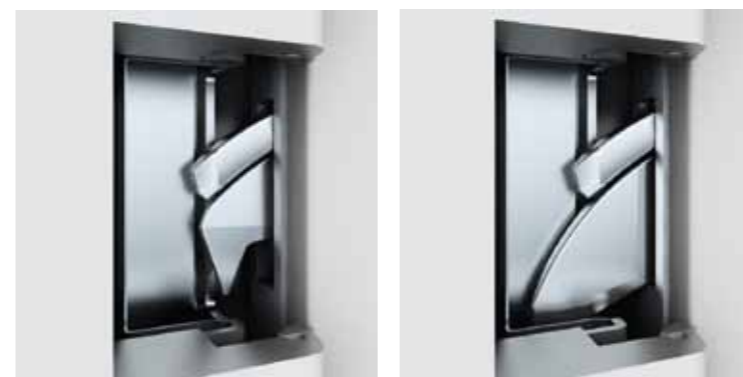
Rygiel hakowy z elementem uszczelniającym w trakcie ryglowania... i po zaryglowaniu drzwi.

Po zaryglowaniu drzwi rygle są automatycznie zabezpieczone przed próbą cofnięcia. Dzięki temu zamek autoLock AV3 zapewnia wysoki poziom bezpieczeństwa, jeszcze zanim przekreścimy klucz we wkładce, uruchamiając rygiel środkowy.